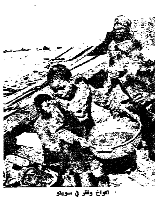
اكواخ وقرى في سويتو